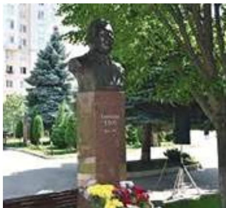
Bustul profesorului Constantin Ețco pe Aleea Savanților și Medicilor Iluștri a USMF Nicolae Testemițanu

Analiza activității profesorului Constantin Ețco demonstrează că moștenirea sa constituie un pilon sistemic pentru transformarea educației medicale și a politicilor de sănătate din Republica Moldova.